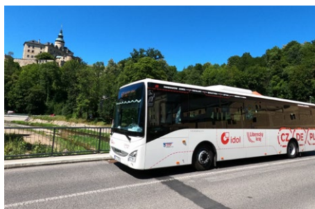
Nová víkendová linka propojila tři státy.

Unikátní autobusová linka č. 691 propojila české, německé a polské pohraničí. Každý víkend jede po trase Hrádek nad Nisou – Zittau – Bogatynia – Frýdlant – Nové Město pod Smrkem – Świeradów-Zdrój a zpět. Jízdné je možné hradit v korunách, zlotých nebo eurech. Až do 22. listopadu platí speciální propagační zvýhodněné jízdné, ale do budoucna se počítá s klasickým jízdným IDOL. Provoz autobusů zajišťuje krajský dopravce ČSAD Liberec a veškeré informace o spoji najdete na www.iidol.cz/bus691 .