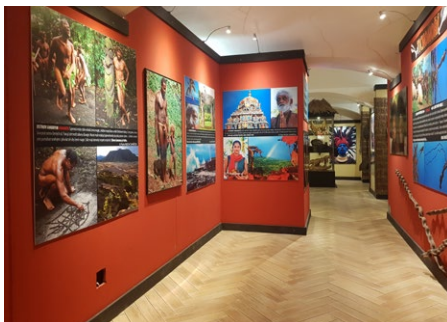
Unikátní výstava odhaluje život, zvyky a krásy tajemné Indonésie.

Největší výstava svého druhu ve střední Evropě odkrývající taje i krásy Indonésie, kterou podpořil i Liberecký kraj, je umístěna v Centru Babylon v Liberci. Expozice odhaluje zajímavosti ostrova Nová Guinea i celé Indonésie, Pacifiku a Šalomounových ostrovů. Návštěvníci se seznámí s nevšedními poznatky z výprav slavných cestovatelů