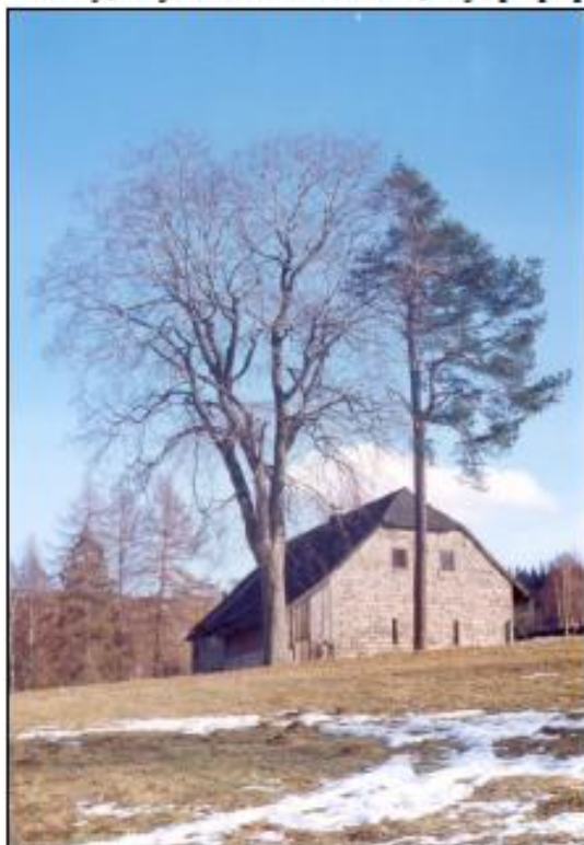
Č.p. 7 - U Huštička (-jas- 1993)

Vydáme-li se ze středu naší obce po cestě, počínající mezi domky Macákových a Syrovátkových k Černé studnici, budeme zároveň kráčet po staré vozové cestě, staré spojnici mezi Novou Vsí a Horní Černou Studnicí. Mineme usedlost Pillerových, kde u domu spolu se stodolou stojí i bývalá mačkárna. Tyto dvě stavby, stojící hned vedle sebe, nejlépe připomínají, na jakých základech vyrostla naše obec. O něco výš ve