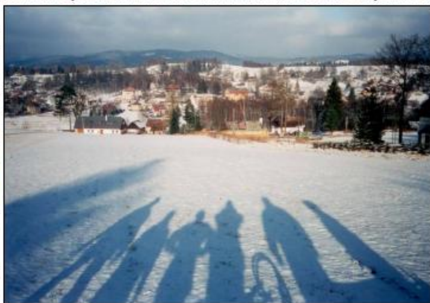
Pohled ze „Stamlberku“ do vsi (-jas- 1/2003)

laskavý a mimoto spolehlivý: za pět zlatek kdykoliv opatřil srnce. Stačilo jen vzkázat nebo promluvit a nechat přes noc